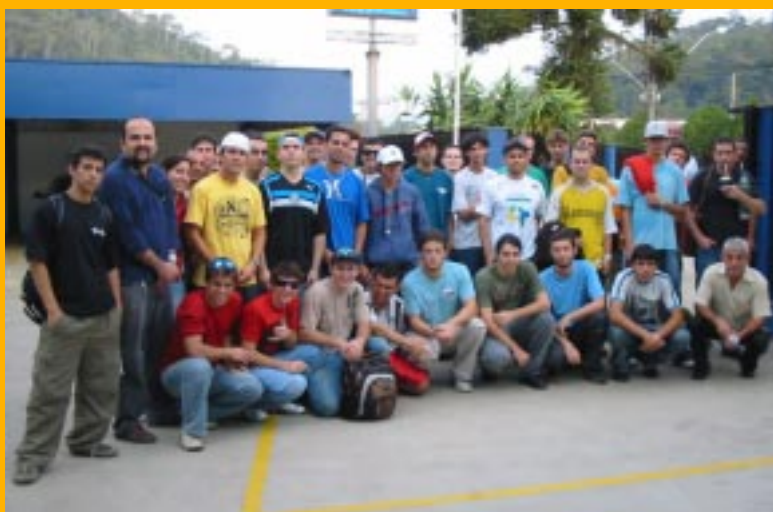
Alunos dos cursos de automação e técnico de mecânica industrial do CEFETSC

Recebemos a visita dos alunos dos cursos de automação industrial e técnico de mecânica industrial, do Centro Federal de Educação Tecnológica da Santa Catarina, e dos alunos que estão sendo preparados pela APAE para inclusão no mercado de trabalho.