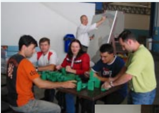
Participantes do curso durante uma aula dinâmica

O curso de formação de líderes dá aos participantes a oportunidade de vivenciar situações diversas que dinamizam o aprendizado. Alguns momentos são especiais, como uma conversa com a diretoria e dinâmicas ao ar livre.