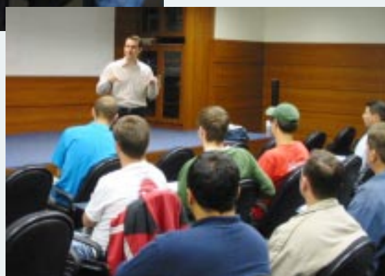
Conversa com a Diretoria da ZM