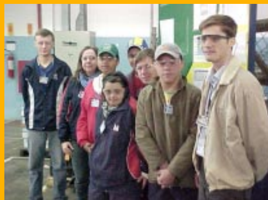
Alunos da APAE em preparo para ingressar no mercado de trabalho