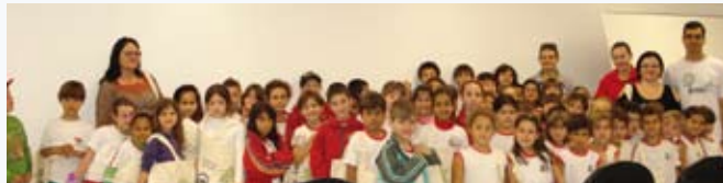
Palestra Meio ambiente para os alunos da Escola Augusta Knorring