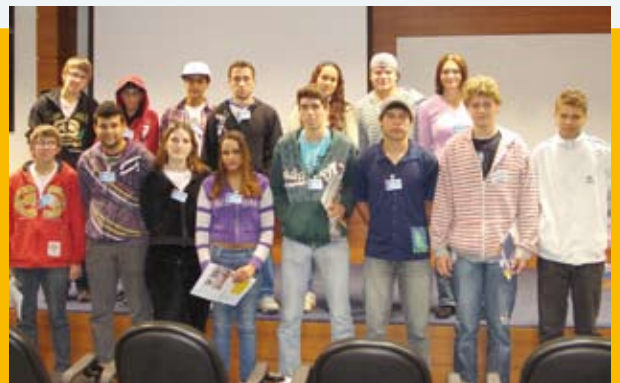
Alunos E.E.F. Profª Augusta Knorring – SESI Escola.

Nos meses de agosto e setembro recebemos três grupos de visitantes que conheceram nossa cultura organizacional e processos produtivos.