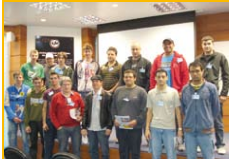
Curso Técnico em Logística – SENAC.