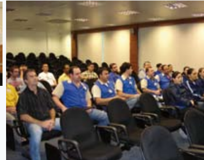
Palestra sobre meio ambiente aos funcionários da empresa.