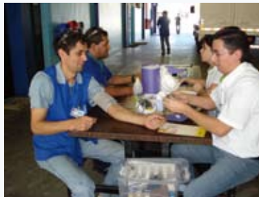
Teste de glicemia.