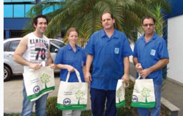
Foram entregues sacolas ecológicas aos funcionários da ZM

Todo ano acontece na empresa a SIPAT – Semana Interna de Prevenção de Acidentes do Trabalho. A Sipat 2010 ocorreu de 18 a 22 de outubro. Nela, ações são tomadas para prevenção de acidentes, uma delas é o desenvolvimento humano. Os funcionários da empresa são orientados a participar de várias palestras para enriquecer conhecimentos e evitar acidentes. A Sipat também abordou questões voltadas ao meio ambiente e preservação da natureza. Aos participantes, vários prêmios foram sorteados.