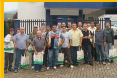
Em 15 de outubro a Alpha Rio visitou a ZM.