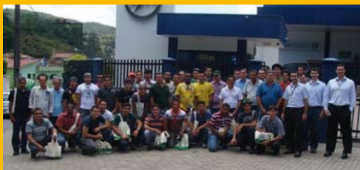
A Soeétrica esteve na ZM no dia 11 de outubro.