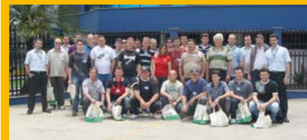
Em 12 de novembro foi a vez da Pegasus.