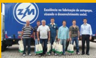
No dia 15 também a Tufão nos visitou.